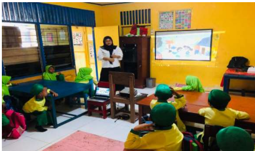
Gambar. Kegiatan Pembelajaran Menggunakan Media Video Animasi