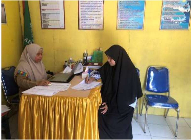
Gambar wawancara kepala sekolah