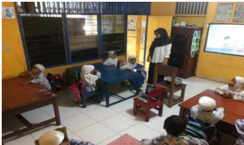
Gambar Siswa Saat Berdoa