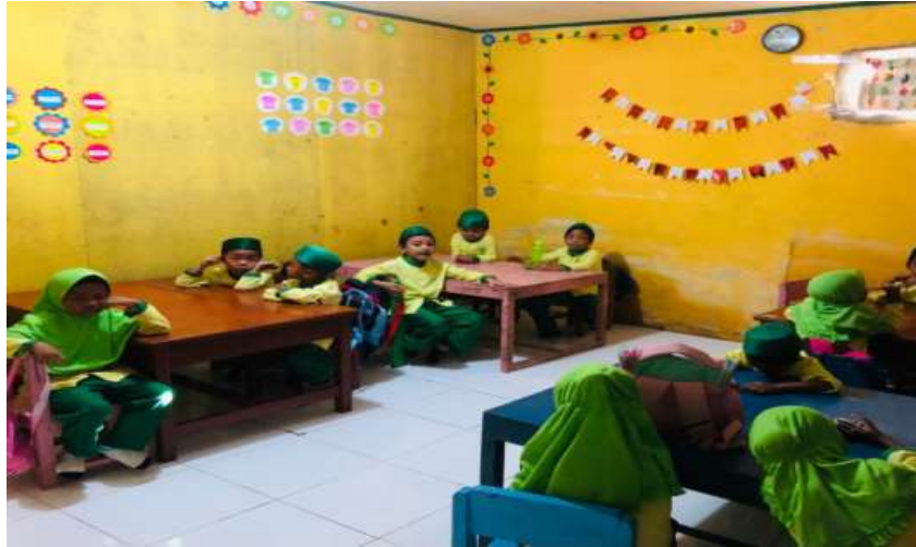
Gambar Mulai Kegiatan Belajar Mengajar