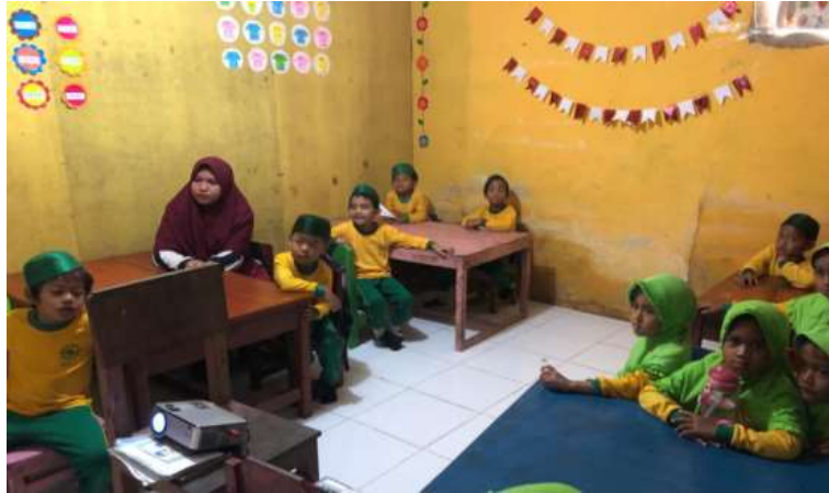
Gambar.kegiatan Pembelajaran Menggunakan Media Video Animasi