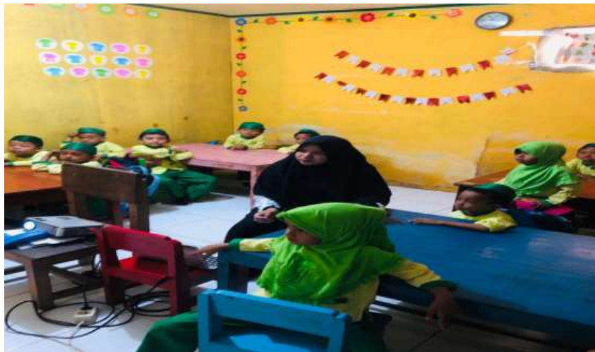
Gambar. Kegiatan Pembelajaran Menggunakan Media Vidio Animasi