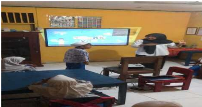
Gambar Kegiatan evaluasi setelah pembelajaran selesai